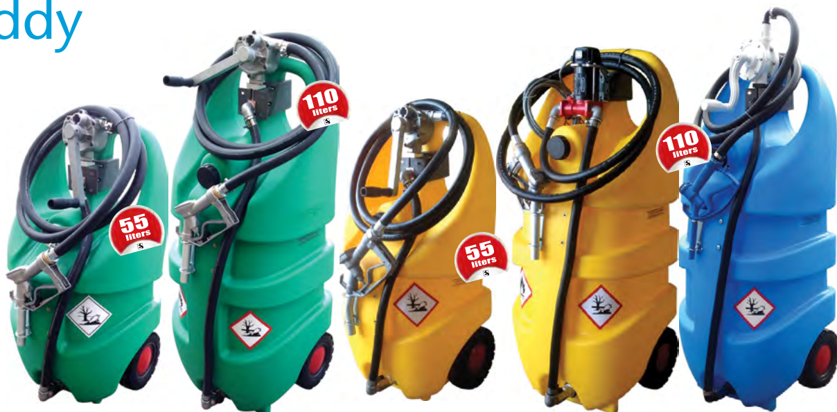
Benzina - Gasoline - Essence

F Récipient en polyéthylène pour le transport de carburants homologué conformément à la norme ADR